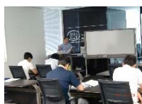
相続対策の セミナー風景