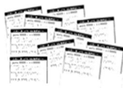
お客様からの お礼の手紙